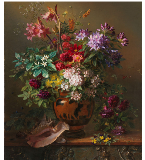
Bild: Stillleben mit Blumen in einer griechischen Vase: Allegorie auf den Frühling, Georgius Jacobus Johannes van Os, 1817, aus der digitalen Ausstellung des Rijksmuseum in Amsterdam.

Doch all diese Vorschläge sind nur ein kleiner Trost für den gesellschaftlichen Teil, der momentan zu kurz kommt. Die Kulturkommission wünscht Ihnen umso mehr Zuversicht und einige kulturelle Entdeckungen in den Weiten des Webs.