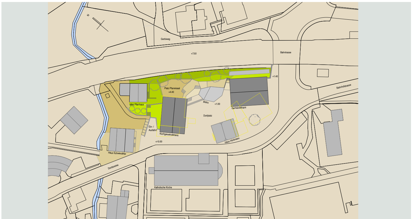
Situationsplan (Stellung der Bauten Kirchgemeindehaus, Gemeindeverwaltung mit Bistro, organische Gestaltung des Terrains zum Bahndamm)