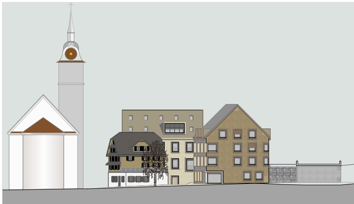
Gesamtansicht Seite Bahnhof Südost