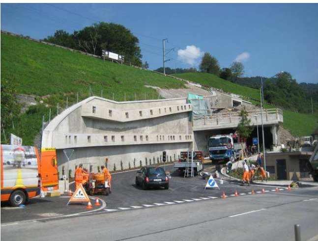
Letzte Arbeiten vor der Eröffnung (Markierung, Bepflanzung).