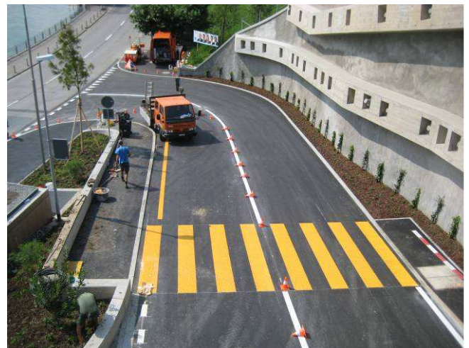
Neue Hörndlirainstrasse von der Galeriedecke her gesehen.