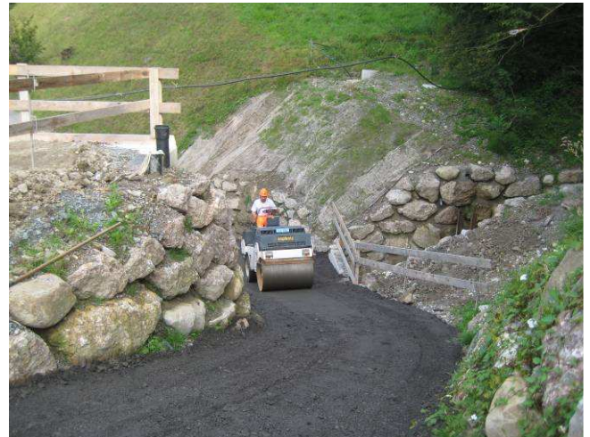
Vorbereiten des Zufahrtsweges für Eröffnung.