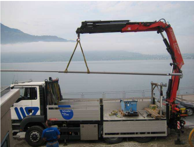
Versetzen des Kandelabers Zugerstrasse.