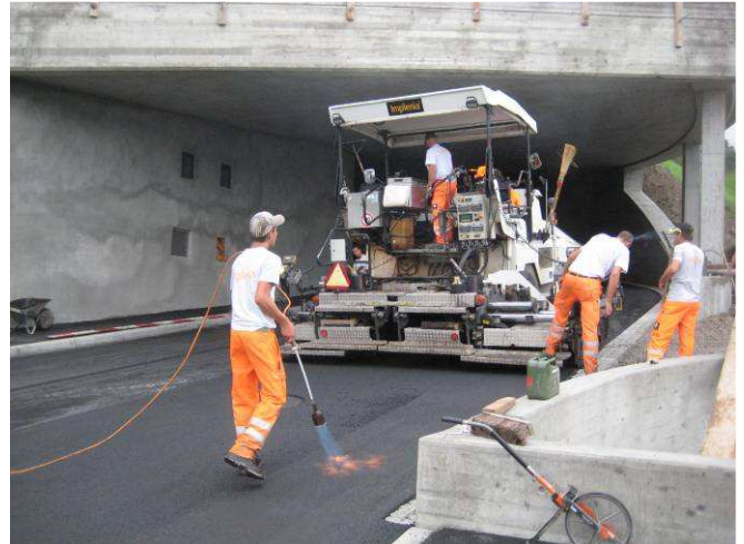
Einbau des Deckbelages Hörndlirainstrasse.