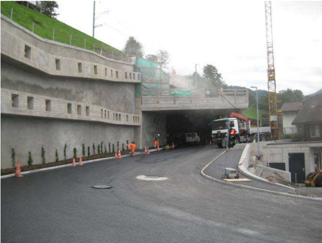
Tragschicht Hörndlirainstrasse eingebaut.